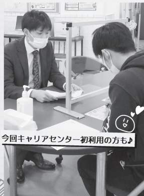
今回キャリアセンター初利用の方も

キャリアセンターでは、後期授業の開始に伴い、オンライン面談等ができないなどの理由がある場合、4年生の学生を対象に対面方式による個別面談を開始。続いて11月からは、3年生も利用可能になりました。